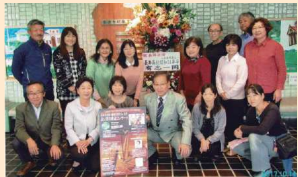
〔第2回公演の実行委員〕

公演最後には、長井高校合唱部と一緒に66名の観客全員で、「広い河の岸辺」を歌い、大いに盛り上がりました。このコンサートの模様は、翌朝の『山形新聞』に大きく掲載されました。